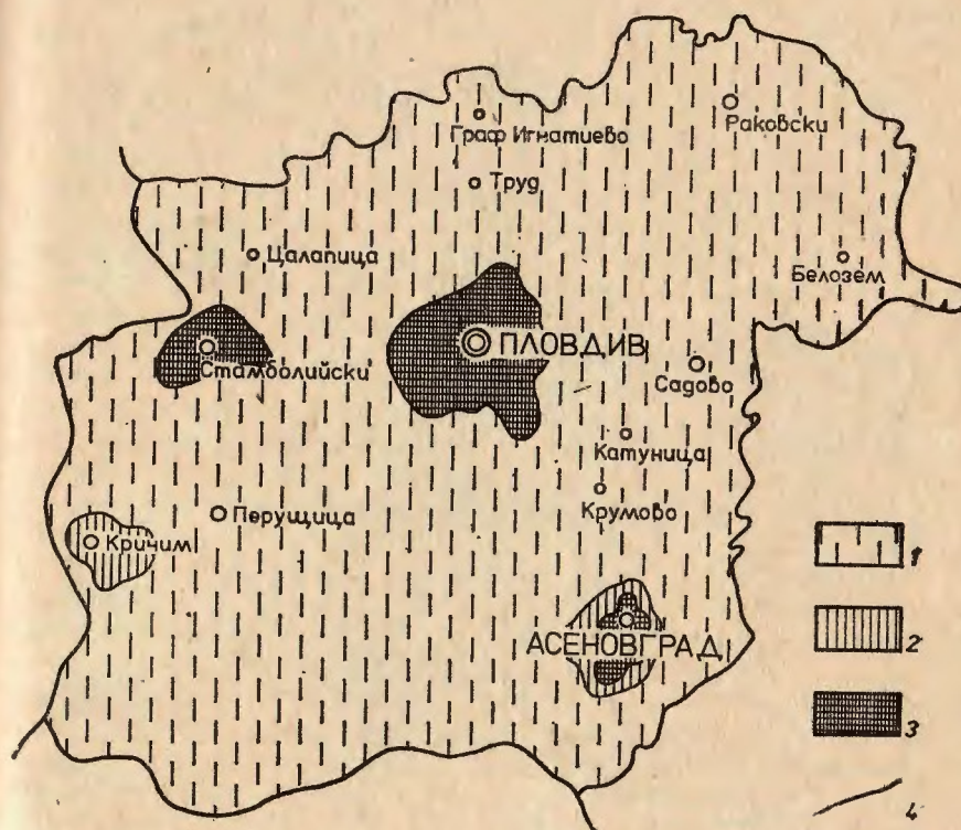
Фиг. 1. Активно население в неселскостопанските отрасли в Пловдивската агломерация през 1965 г. (в % от цялото активно население на селищата) 1 — под 50; 2 — от 50 до 75; 3 — над 75; 4 — граница на агломерацията Fig 1. Active population in nonagricultural sectors in Plovdiv agglomeration in 1965) % from the total active population in the settlements). 1 — below 50; 2 — between 50 and 75; 3 — above 75; 4 — agglomeration boundary

под 1000 ж. и с твърде неблагоприятна за възпроизводството възрастова структура — силно увеличен дял на възрастното население и много нисък на младите възрасти. Към тази група спадат и няколко най-големи села — Цаланица 42,0%, Брестовица 46,5%,