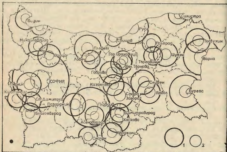
Фиг. 3. Зони на влияние на градовете с население над 30 хил. жители за 1982 г.

райони (окръзи) и микрорайони (селищни системи-общини); ж) развитието на градовете и градската мрежа да се покрива от методите на териториалното планиране и управление; з) в перспектива да се