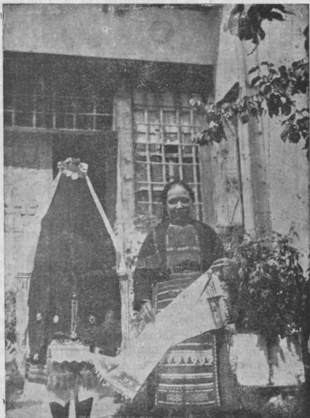
Обр. 2. Прекрита невѣста, водена отъ калиманата, с. Каяджикъ, Димотишко.

Червено е булото на невѣстата и у „Шиковцитѣ“ въ Силистренско 3) и въ Бердянско (Ю. Русия 4) ). Въ Таврида пъкъ червено или бѣло 5) . Въ махалата Лазарци (Еленско) кръстни-