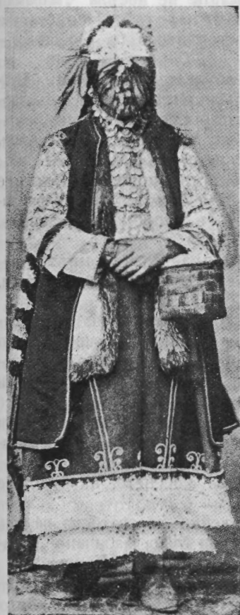
Обр. 3. Невѣста отъ Софийско

Днесъ въ Софийско на много мѣста забулватъ лицето на невѣстата съ червена мрежа, разбира се, като се оставатъ на